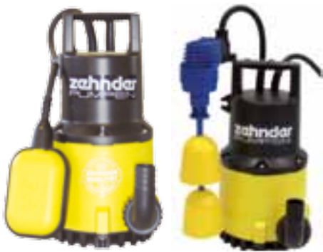
ZPK 35 A