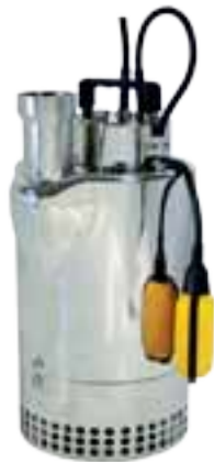
E-BW 180 A